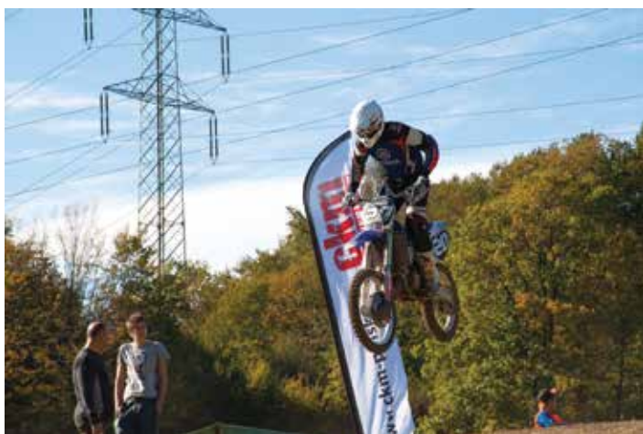
Zajęcia w szkółce motorowej będą się odbywać pod okiem licencjonowanych trenerów.