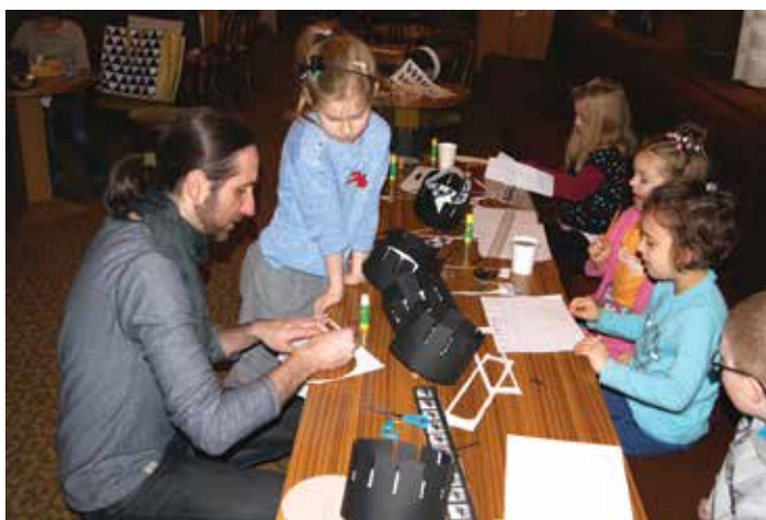
Zajęcia teatralne „Latarnia magiczna”.