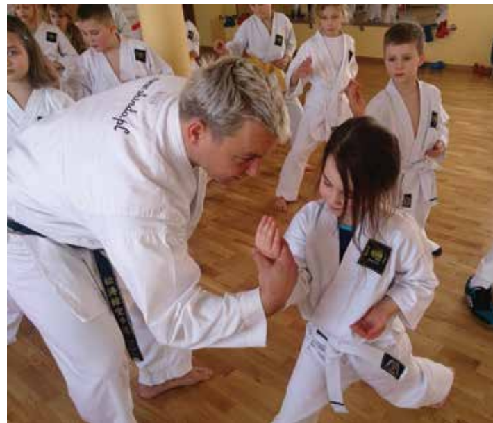
Zimowisko sprzyjało efektywnym treningom karate.