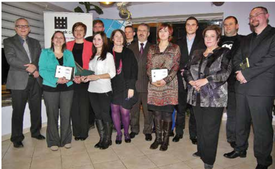
W noworocznym spotkaniu Klubu Przedsiębiorcy wzięli udział przedsiębiorcy i przedstawiciele samorządu.