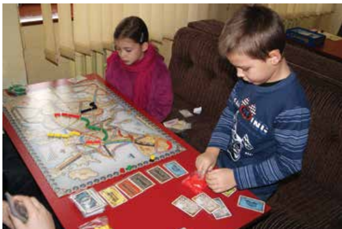
Dzień gier bez prądu.