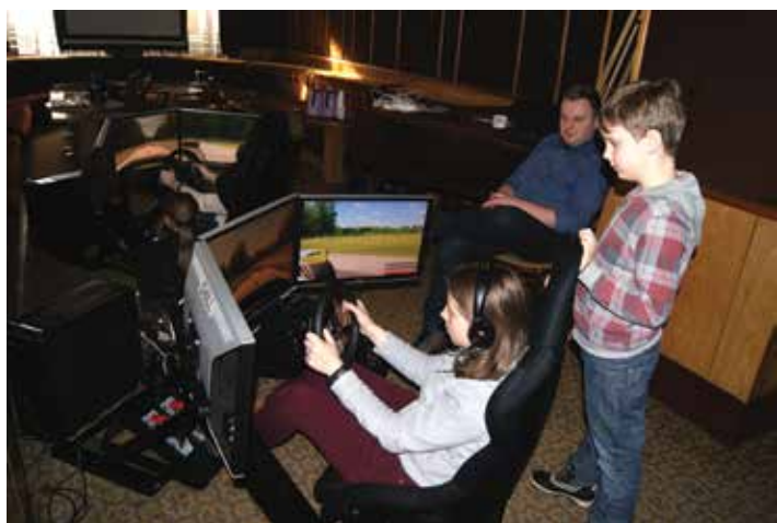
Szkoła jazdy na symulatorach VRS.