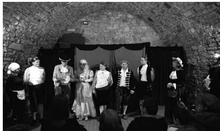
Spektakle Johna Whitewooda nawiązują swoim stylem do dzieł z okresu teatru elżbietańskiego.

Grupa „Baj(k)arzy” serdecznie zaprasza na najnowszą sztukę Johna Whitewooda pt. „MALWINA”. Prapremiera odbędzie się w Domu Narodowym w Piwnicy Artystycznej 22 lutego (sobota) o godz. 18.00. Wszystkich tych, którzy chcieliby obejrzeć przedstawienie, prosimy o wcześniejszy kontakt celem rezerwacji miejsc: tel. 500 099 450 (ilość miejsc ograniczona).