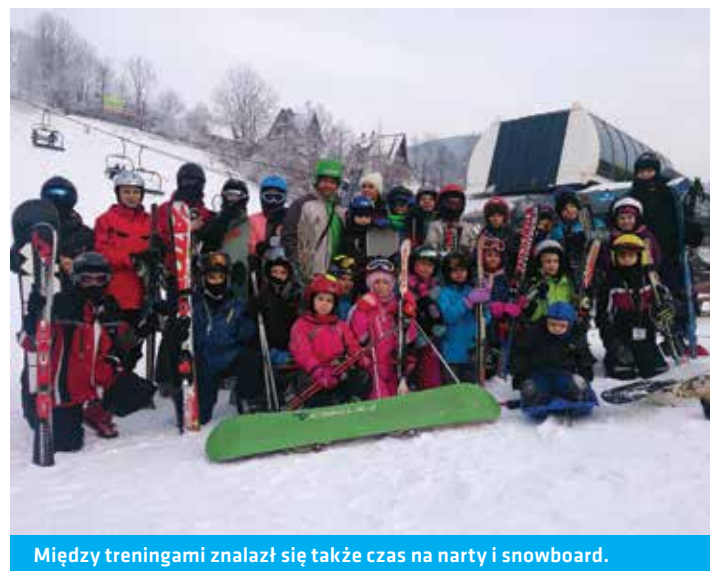
Między treningami znalazł się także czas na narty i snowboard.