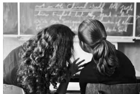
Zebrane w ankiecie odpowiedzi pomogą ocenić stan cieszyńskiej oświaty.

Ankieta ma charakter anonimowy. Zebrane informacje mają charakter jedynie