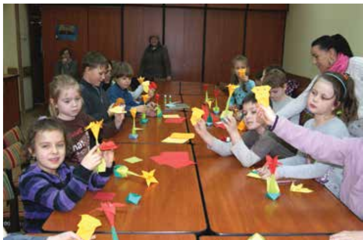
Warsztaty origami - „Zaczarowany świat papieru”.