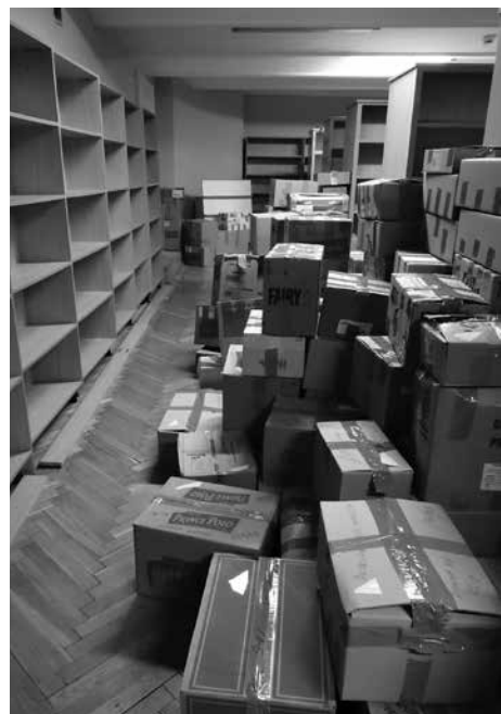
Zbiory i wyposażenie Biblioteki zostały przeniesione i prace remontowe ruszyły pełną parą.

Dyrekcja i pracownicy Biblioteki Miejskiej składają serdeczne podziękowania Zespołowi Szkół Budowlanych im. gen. Stefana Grota Roweckiego w Cieszynie, firmie KARTON-PAK, Starostwu Powiatowemu i Urzędowi Miejskiemu w Cieszynie za pomoc w przewiezieniu księgozbioru, sprzętu i mebli bibliotecznych.